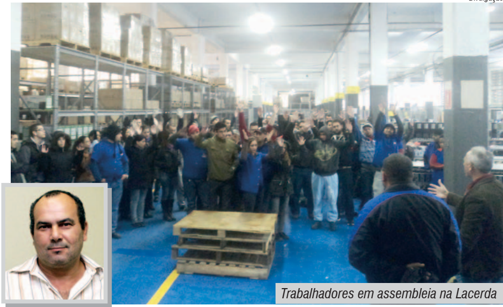
Trabalhadores em assembleia na Lacerda

"Todos estão de parabéns pelo belo trabalho em equipe e mobilização", concluiu.